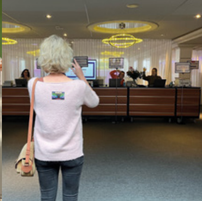
SWC ReeHorst Ede