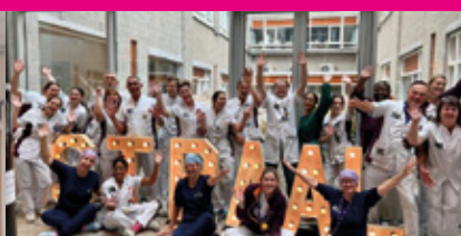
Albert Schweitzer ziekenhuis