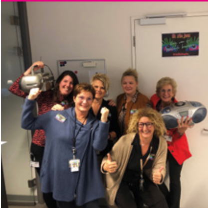
Meander Medisch Centrum