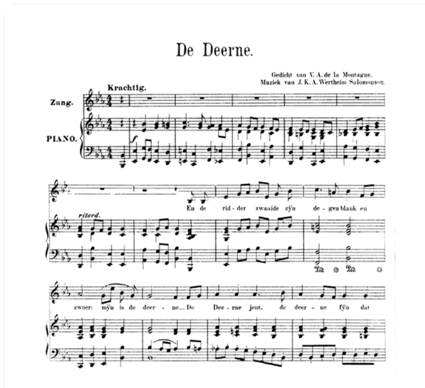
Figuur 5. Drie eerste notenbalken van het lied De Deerne.

Maar ook in hogere kringen werden zijn stukken uitgevoerd. In het plakboek dat