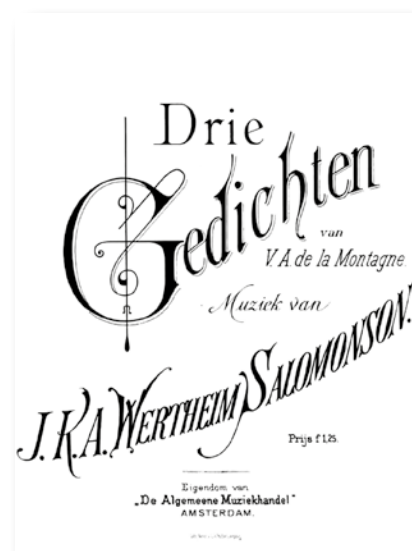
Figuur 4. Voorblad Bladmuziek.

Dela Montagne behoorde tot een groep dichters, wier slechts korte kern van bestaan rond die jaren 1880-85 haar hoogtepunt toonde. De inleider tot zijn dichtbundel Gedichten schrijft dat ►