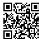
Figuur 6. Pianoklanken van het lied Op de Hoeve.