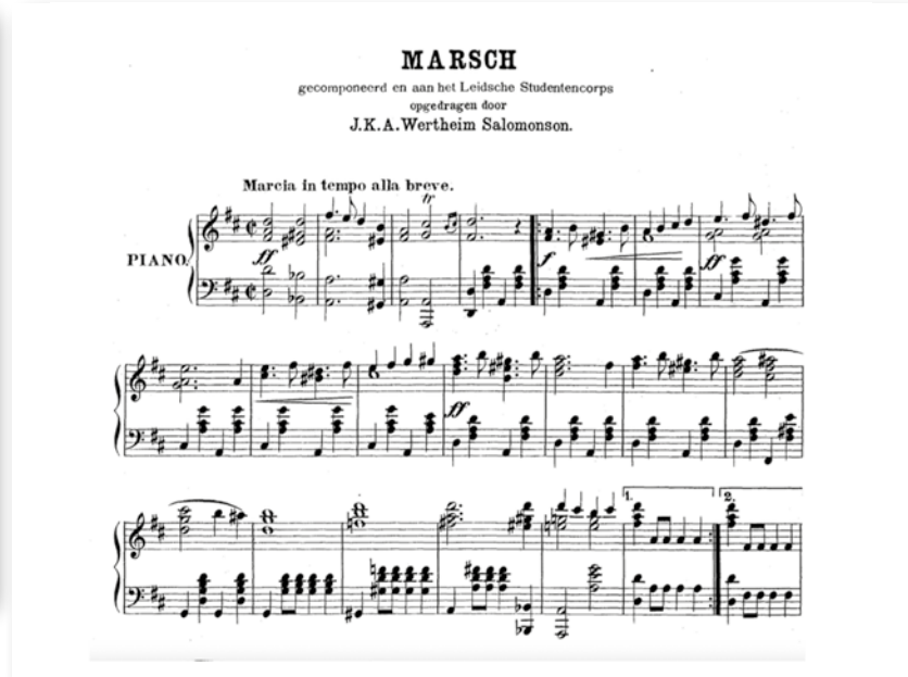
Figuur 3. Drie eerste notenbalken van de Feestmars.