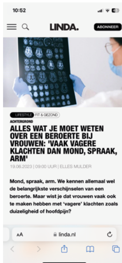
Oorspronkelijke beeld om 10:52 uur.

De boegbeelden die we in de vorige MemoRad hebben voorgesteld, doen er alles aan om de kernboodschappen uit te dragen in het land zowel binnen als buiten de radiologie. Recent heeft snel schakelen binnen deze groep in een correctie gere-