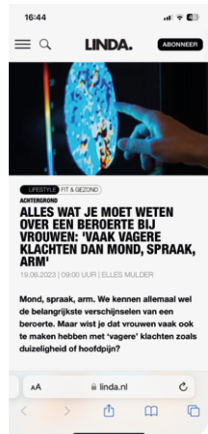
Aangepaste beeld om 16:44 uur.