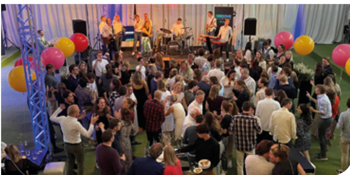
Feest met muziek van Groove Department.