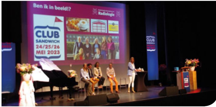
Ontbijtje met het bestuur.