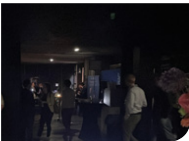
Paniek! Gelukkig werd de stroomstoring snel verholpen.