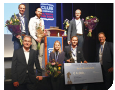
Arjon Hoekstra van Philips met de winnaars van de Frederik Philips-prijs 2023.