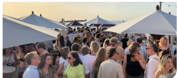
Diner en feest in de Alexander Beach Club in Noordwijk aan Zee.