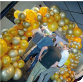
Start van de dag.