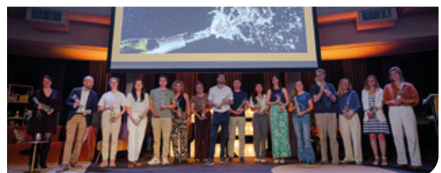
De jonge klaren uit 2025 worden welkom geheten als radioloog en de NVvR laat voor iedere jonge klare twee bomen planten.