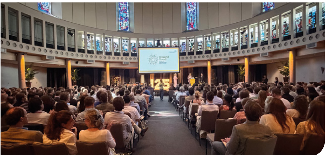
Een volle plenaire zaal.

De volgende editie van de Radiologendagen vindt plaats op donderdag 27 en vrijdag 28 mei 2027 . Zet deze data alvast met potlood in je agenda. We houden je op de hoogte via alle bekende kanalen.