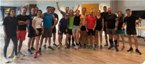
Sportief en gezellig: een ochtendronde samen met je stralende collega's.