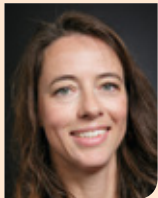
Indra Dennert van Alrijne Ziekenhuis in Leiden en Leiderdorp naar Spaarne Gasthuis in Haarlem per 1 september 2024

Wie werkt waar? Blijf up-to-date van de banencarrousel dankzij tante Bep, in samenwerking met het bureau van de NVvR.