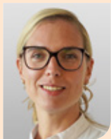
Anne van Duijn van Haaglanden Medisch Centrum in 's-Gravenhage naar St. Jandal in Harderwijk per 1 november 2024