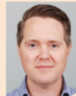
Laurens la Gro van fellow abdomen naar staf Máxima MC in Veldhoven en Eindhoven per 1 februari 2025