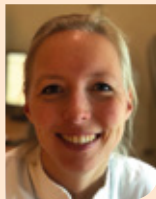
Esther Pompe van Meander Medisch Centrum naar UMCU in Utrecht per 1 januari 2025