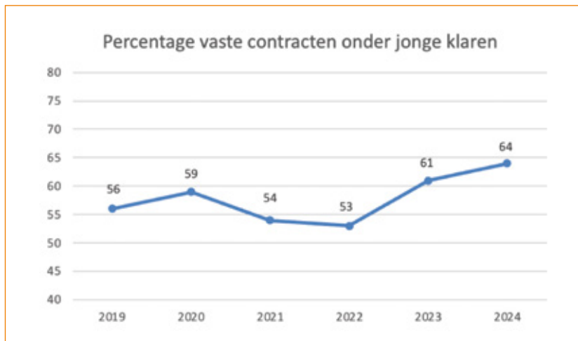
Figuur 1. Percentage vaste contracten onder jonge klaren. De verschillende percentages komen uit de enquête van dat betreffende jaar.

de enquête het vaakst ingevuld (18,9%). In de overige jaren lag het percentage tussen de 9,1% en 16%. De meeste reacties kwamen van jonge klaren werkzaam in de opleidingsregio Amsterdam